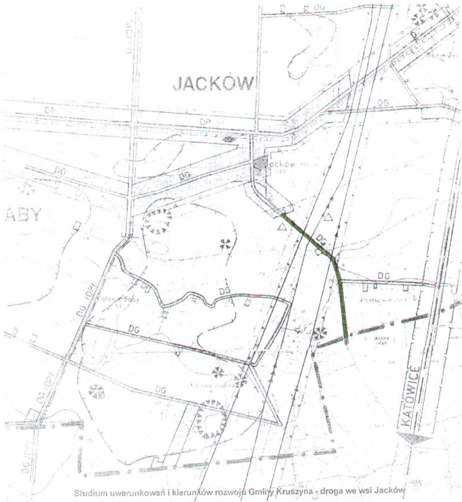
Studium uwarunkowań i kierunków rozwoju Gminy Kruszyna - droga we wsi Jacków